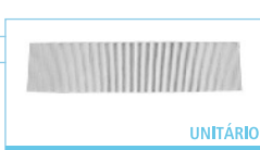
807 x 21 x 187mm FB012020 UNITÁRIO