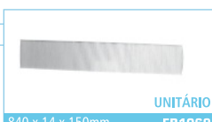
840 x 14 x 150mm FB1069 UNITÁRIO