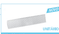
585 x 20 x 110mm FB1177 UNITÁRIO NOVO