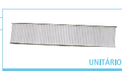
778 x 17 x 155mm FB012010 UNITÁRIO