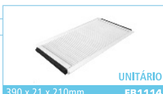
390 x 21 x 210mm FB1114 UNITÁRIO