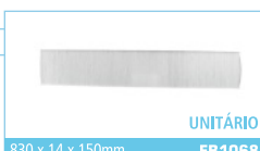
830 x 14 x 150mm FB1068 UNITÁRIO