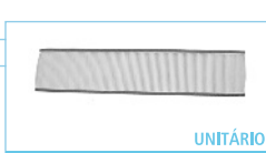
780 x 18 x 170mm FB1121 UNITÁRIO