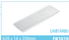
628 x 14 x 200mm FB1070 UNITÁRIO