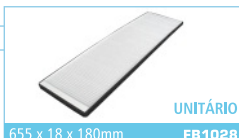
655 x 18 x 180mm FB1028 UNITÁRIO