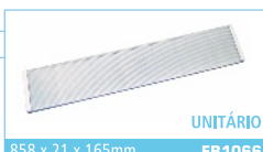
858 x 21 x 165mm FB1066 UNITÁRIO