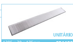
1395 x 30 x 175mm FB1136 UNITÁRIO